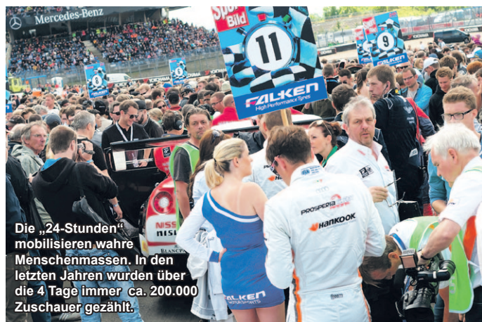
Die „24-Stunden“ mobilisieren wahre Menschenmassen. In den letzten Jahren wurden über die 4 Tage immer ca. 200.000 Zuschauer gezählt.

Wo/Wann: 14.-17.05.'15, Nürburgring Gesamtstrecke